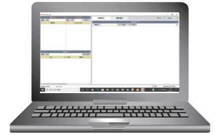
管理PCにMSマネジャーをインストール