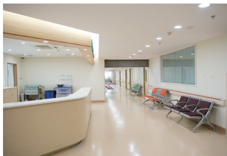
病院・クリニック