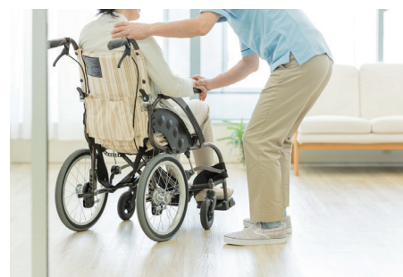
介護施設・老人ホーム